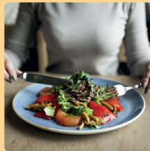
Test de Sensibilidad alimentaria

Este test analiza 204 alimentos de la dieta mediterránea con el objetivo de conocer la presencia de sensibilidad a alguno de ellos.