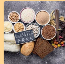
Test Genético de enfermedad celíaca

Esta prueba genética detecta la presencia de los principales heterodímeros relacionados con la Enfermedad Celíaca. Va a permitir conocer la predisposición de reaccionar de forma negativa a la ingesta de alimentos con gluten, y poder así tomar medidas preventivas oportunas.