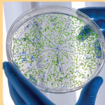
Estudio de Disbiosis Intestinal Ampliado

A partir de una muestra de heces podremos conocer la composición de nuestra microbiota intestinal y valorar un posible desequilibrio de la misma (disbiosis).