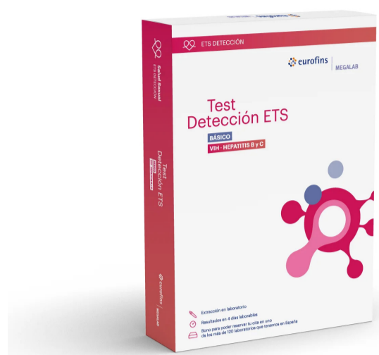
Test de Detección ETS Básico